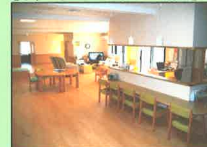
【ちゅーりっぷの里共同生活室】